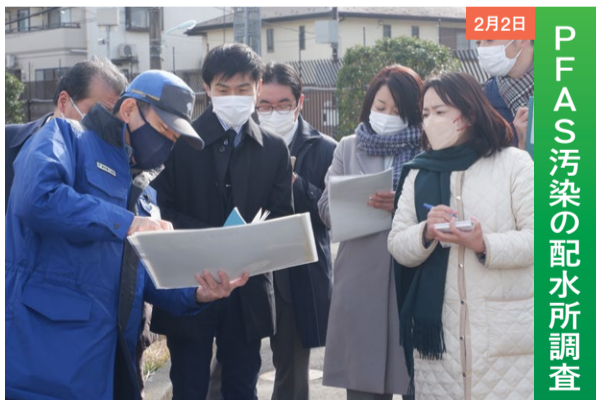
2月2日 PFAS汚染の配水所調査

暫定基準値を超えるPFASが検出され取水を止めている国分寺市の水道施設を調査。汚染源と疑われる米軍横田基地の調査も急務です。