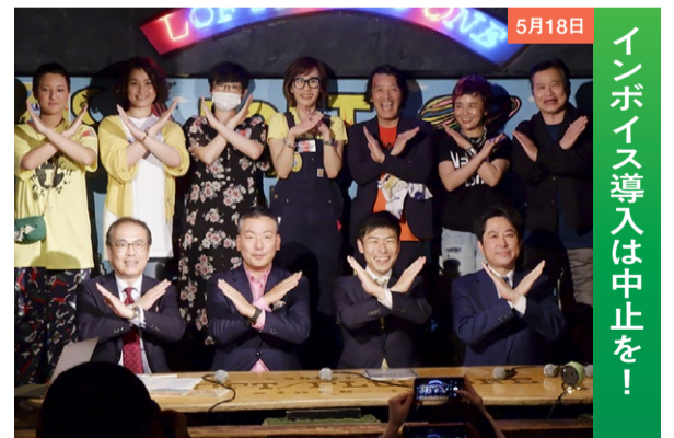
5月18日 インボイス導入は中止を!

軍事利用がねらわれる県営下地島空港、陸上自衛隊ミサイル部隊の配備など「要塞化」が進む宮古島。住民のみならずとも懇談しました。