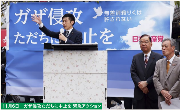
11月6日 ガザ侵攻ただちに中止を 緊急アクション

パレスチナ・ガザ地区での人道危機が深刻です。国連総会は、「人道目的での即時停戦」を求める決議を153カ国の賛成で採択しました(12月12日)。米国は安保理でも国連総会でも停戦決議に反対し、国際社会の平和の願いを妨害する姿勢がいよいよ明らかです。日本政府も態度が問われます。ロシアのウクライナ侵略を批判しながら、イスラエル軍の国際人道法違反を非難しようとならない、米国を忖度したダブルスタンダードはやめるべきです。