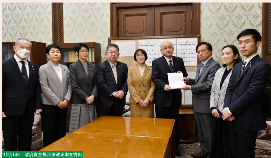
12月5日 政治資金規正法改正案を提出

「政府の立場としてお答えは差し控える」——自らの所属派閥の問題で答弁を拒み続けた閣僚たち。これで幕引きは許されません。国会での証人喚問など真相解明を求めます。これまでも腐敗の温床となってきた企業・団体献金。原則禁止にもかかわらず、抜け穴となってきた一つが政治資金パーティーです。利益率9割という荒稼ぎまで横行し、錬金術と化しています。企業・団体献金はパーティー券も含め全面禁止にと、参議院で法案を提出しました。