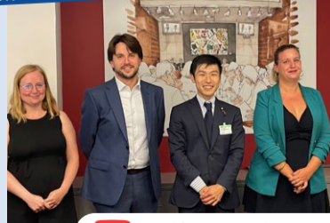
9月19日 左翼政界の議員らと

「服従しないフランス」の国民議会議員とも交流。格差と貧困、ジェンダー、原発、極右政治の危険など話題は尽きませんでした。