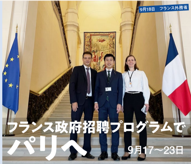
9月18日 フランス外務省