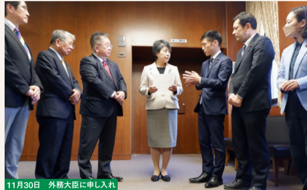
11月30日 外務大臣に申し入れ

米空軍のオスプレイが屋久島沖で墜落、国内で初めての死亡事故となってしまいました。ところが日本政府は米側に飛行停止すら求めず、米軍が全世界で飛行停止を決めてもなお、詳細をつかんでいないといいます。事故機