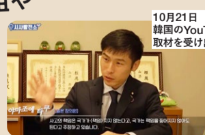
10月21日 韓国のYouTuberの取材を受け出演