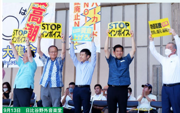
9月13日 日比谷野外音楽堂