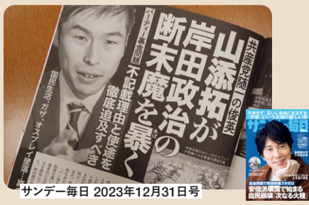
サンデー毎日 2023年12月31日号