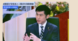
12月19日 BSフジ プライムニュースに出演